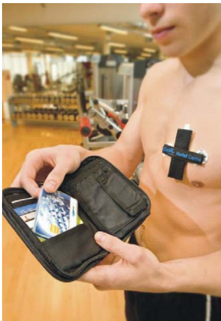
IMEC's draadloze ECG-pleister voor comfortabele detectie van hartritmestoornissen in het dagelijkse leven

Leuven, België – 14 juli 2008 – IMEC ontwikkelde een klein draadloos sensorsysteem dat in staat is om continu het hart te monitoren. De draadloze sensor werd ingebouwd in een plooibaar en rekbaar materiaal en geïntegreerd in textiel zodat ze comfortabel gedragen kan worden op het lichaam. Dergelijke draadloze ECG(electrocardiogram)-pleisters zullen detectie van bijvoorbeeld hartritmestoornissen mogelijk maken tijdens dagdagelijkse activiteiten buiten de ziekenhuisomgeving.